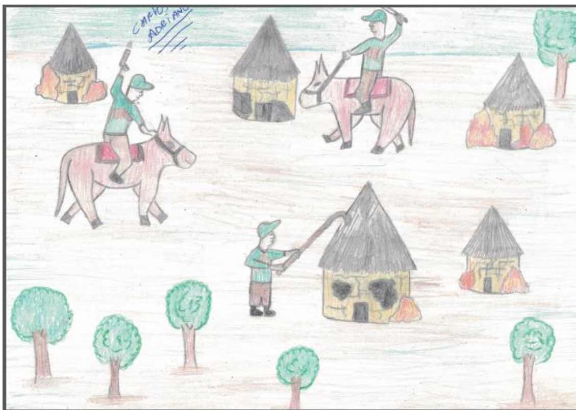
Ilustração VI: A destruição da aldeia no fogo de 51

Fonte: Produzida por Carlos Adriano Braz Ferreira