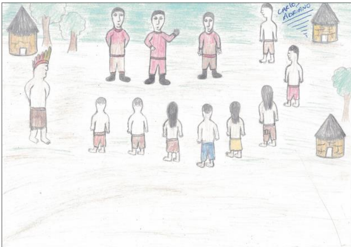
Ilustração IV: A reunião com os homens que prometeram demarcar a terra