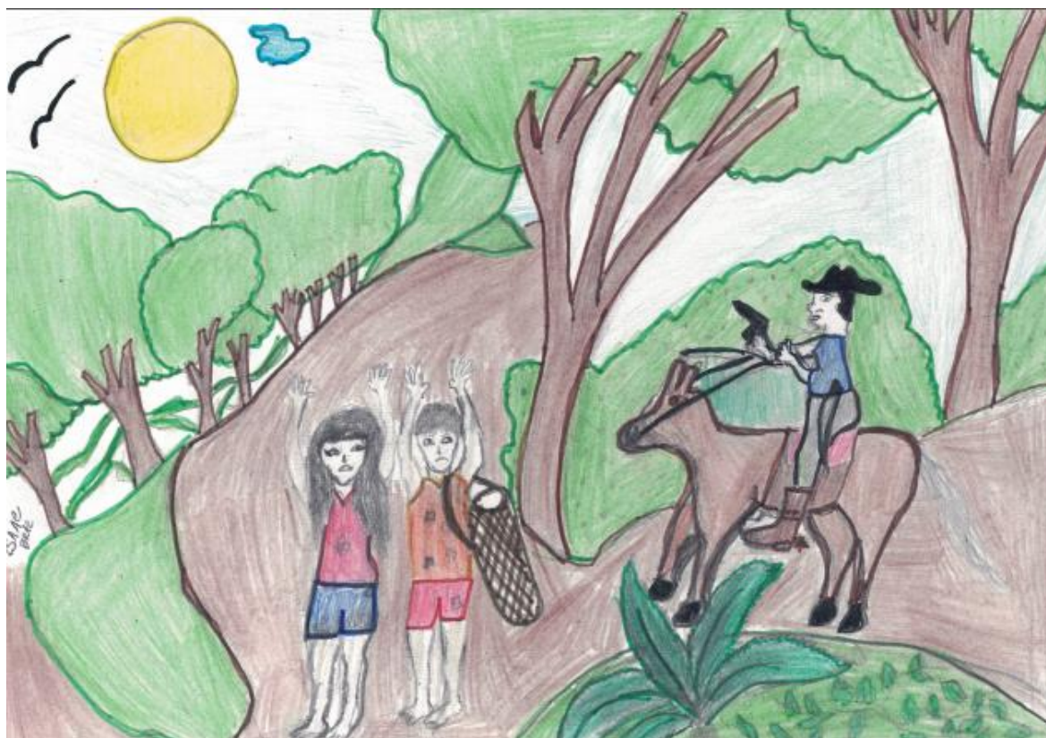
Ilustração XI: As mulheres no caminho do mangue perseguidas pelos guardas do IBDF

Fonte: Desenho produzido por Isaac dos Santos Braz e pintado por Sarah dos Santos Braz