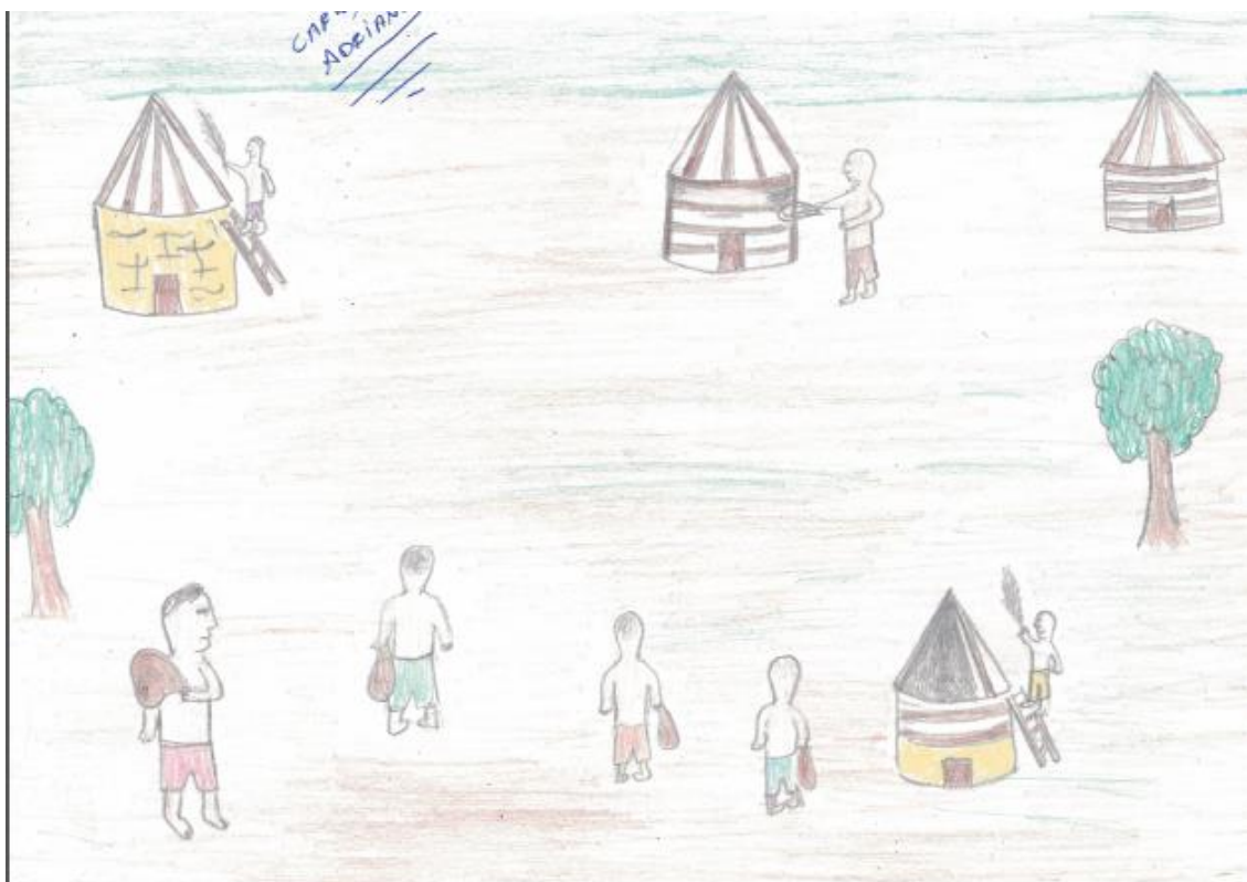
Ilustração VIII: Reconstrução da aldeia depois do fogo de 51