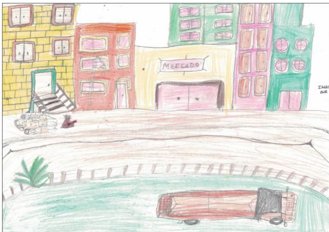
Ilustração X: Palmiro, Epifânio e Luiz dormindo na rua

Fonte: Desenho produzido por Isaac dos Santos Braz e pintado por Isabella dos Santos Braz