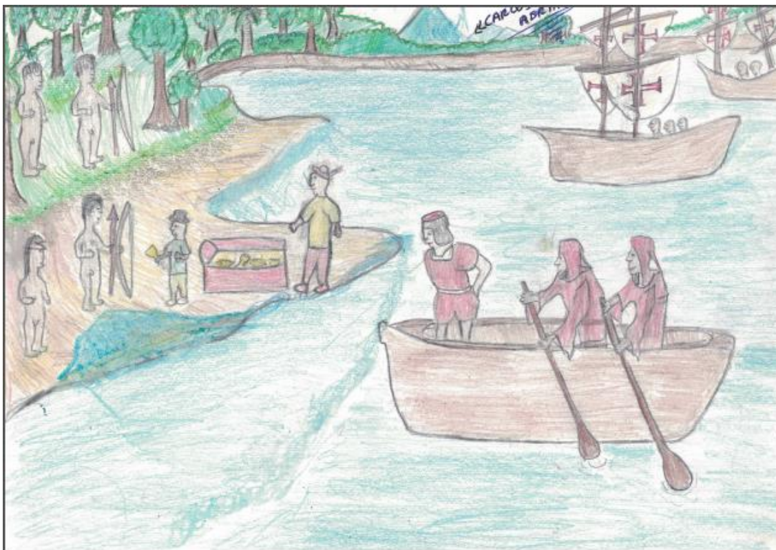
Ilustração II: A invasão dos portugueses no território pataxó (o primeiro contato)

Fonte: Produzida por Carlos Adriano Braz Ferreira