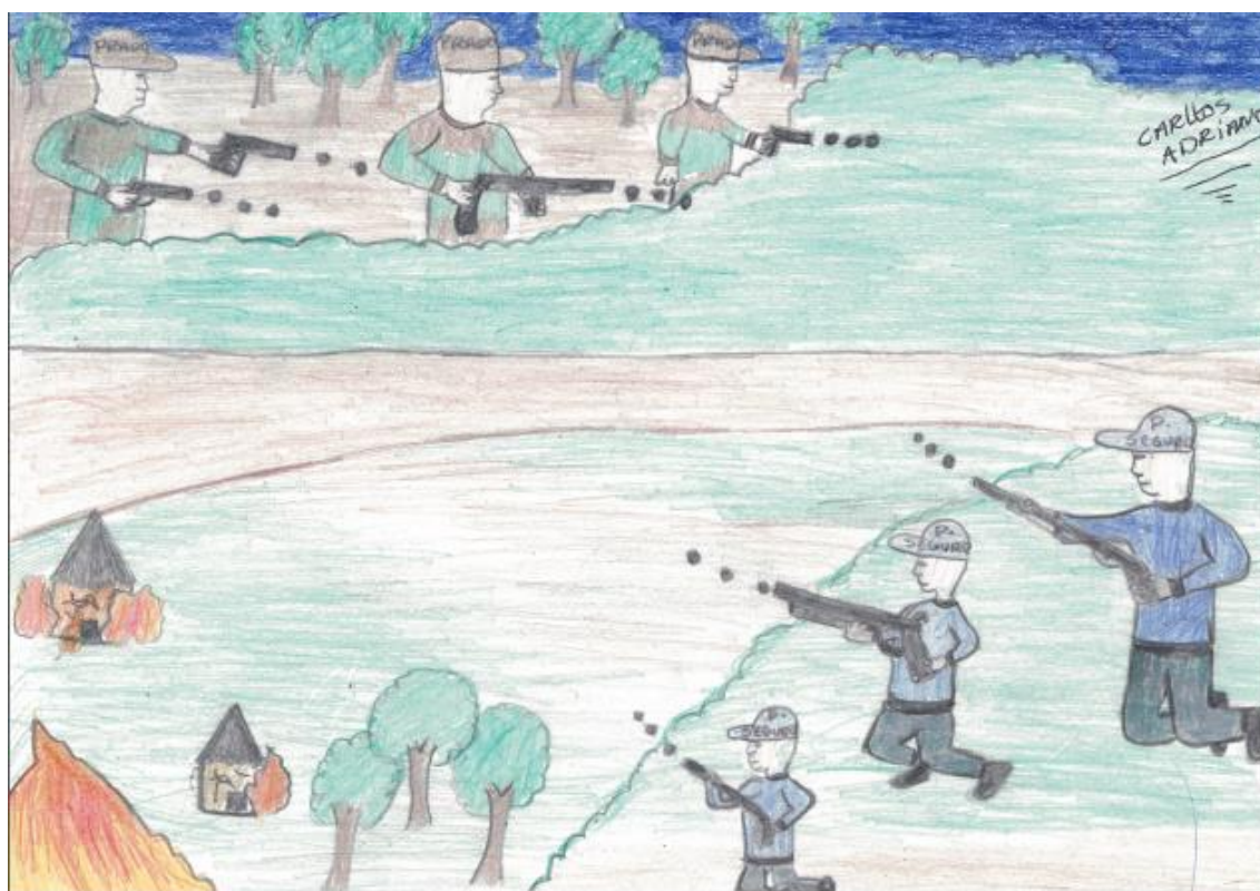
Ilustração V: Início do fogo de 51