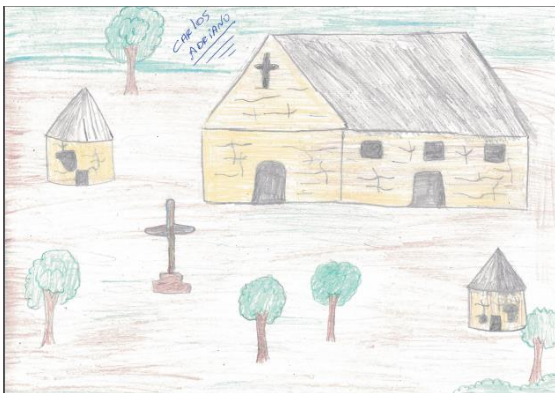
Ilustração VII: A igreja de Nossa Senhora da Conceição