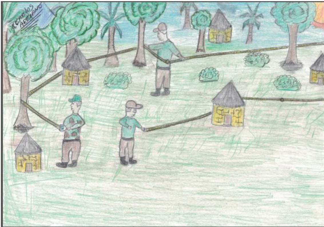
Ilustração III: A demarcação enganosa