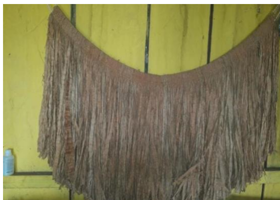
(Tanga de imbirá de biriba)