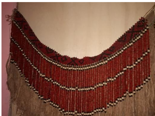
(Cinto de sementes)