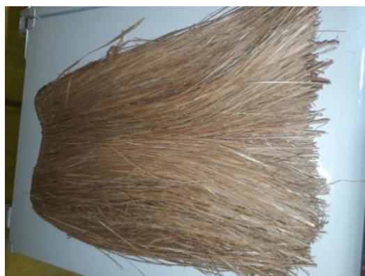
(Tanga de taboa – Arquivo pessoal)

A tanga é uma vestimenta de muito valor e respeito para os Pataxó. É uma vestimenta de uso pessoal utilizada em momento ritual, em batalhas, e é sua companheira em todos os lugares. Cada etnia tem a sua vestimenta com estilos e formas diferentes de serem feitas e usadas. A tanga Pataxó é feita de biriba, uma espécie de árvore da mata, e também de taboa, vegetação encontrada nos brejos. O nome dado a essa vestimenta em Pataxó é ‘tupsay’, que significa ‘roupa’.