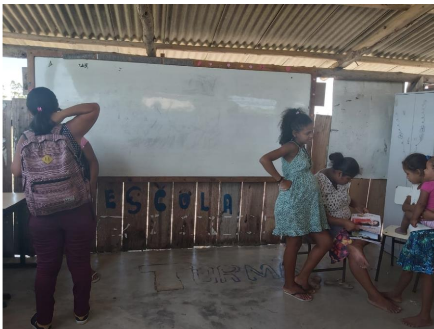
Figura 16: sala de aula aldeia Renascer.

Essa imagem foi tirada em março de 2020 antes da pandemia durante a visita da gestão Kijetxawê Zabelê para planejamento do início do ano letivo, o corpo docente estava esperançoso, pois com o início do acompanhamento pedagógico seria um novo caminho para educação indígena.