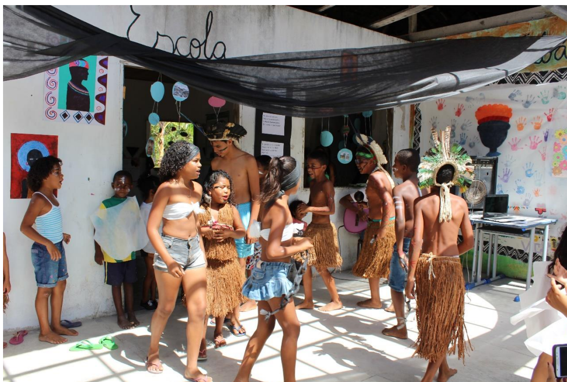
Figura 6: Alunos da aldeia Tibá em apresentação cultural no dia da consciencia negra em 2017.

Atualmente o anexo tem aproximadamente 60 alunos, 6 professoras e 3 serviços gerais e apoio. Tendo as modalidades: creche, fundamental II e EJA.