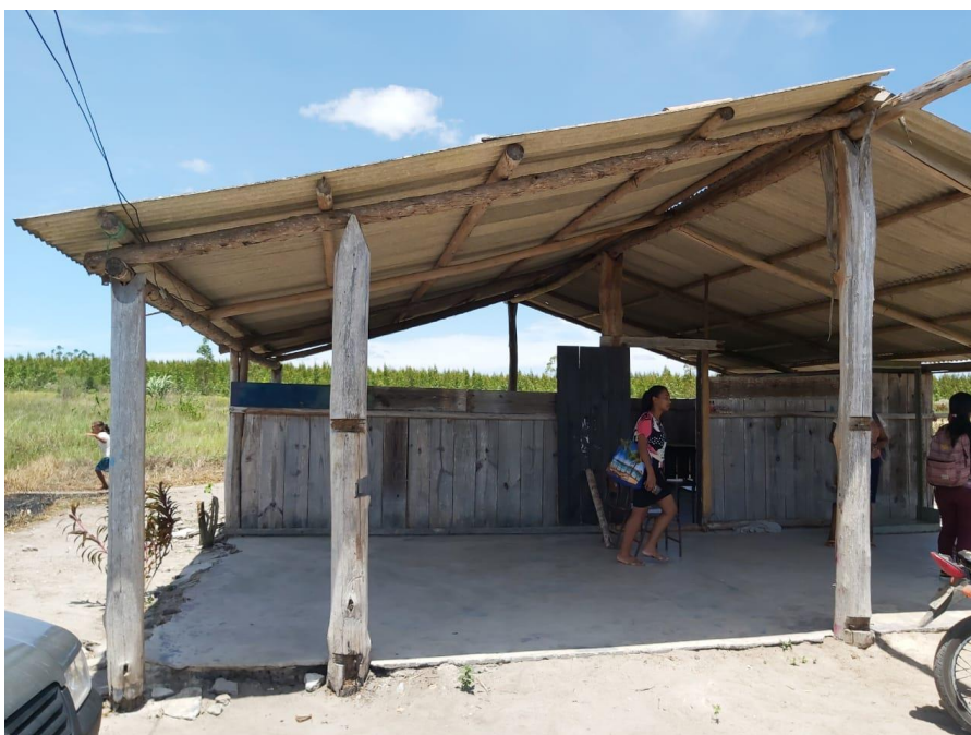
Figura 17: Galpão escolar aldeia Renascer.

Essa imagem foi tirada em março de 2020 antes da pandemia durante a visita da gestão Kijetxawê Zabelê para planejamento do início do ano letivo, o corpo docente estava esperançoso, pois com o início do acompanhamento pedagógico seria um novo caminho para educação indígena.