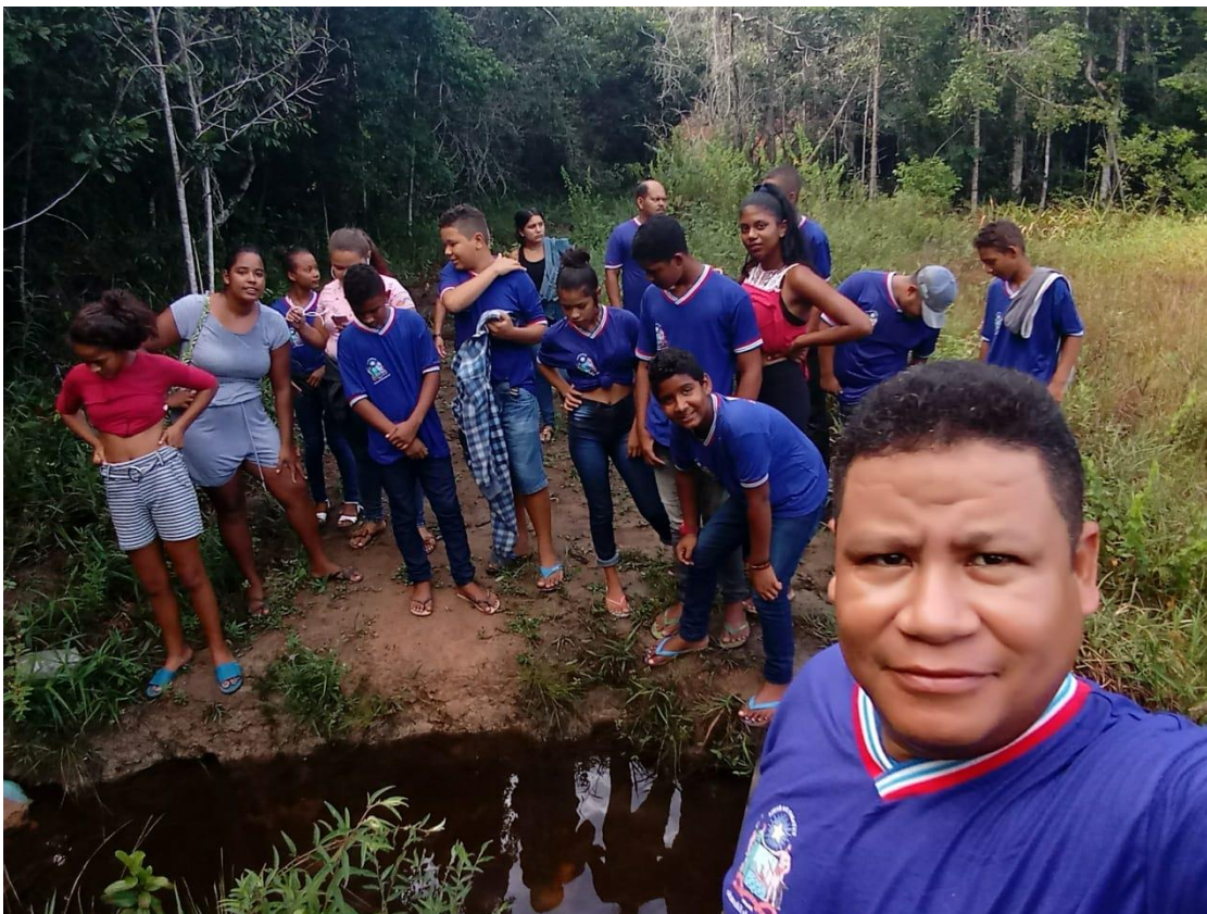
Figura 24: Estudantes do anexo Kaí em aula de campo na nascente de um rio.