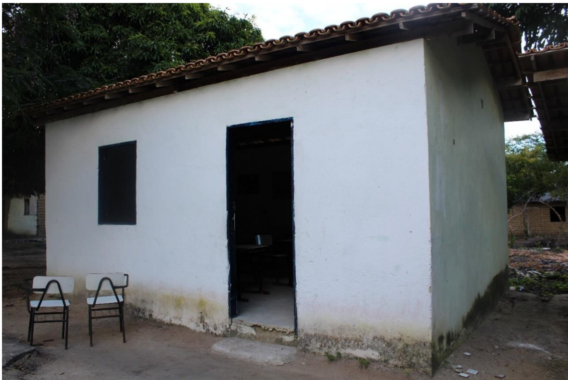
Figura 5: Primeira sala de aula construída dentro da aldeia.

Atualmente está Oca é utilizada como sala de aula para a creche do anexo Tibá e residem duas filhas de Zabelê que tomam conta da cabana.