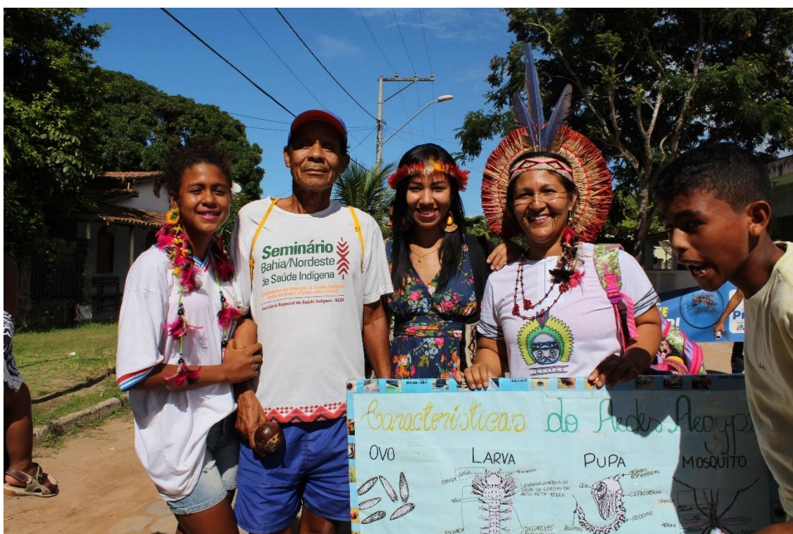
Figura 23: Passeata sobre a dengue com estudantes na vila de Cumuruxatiba.