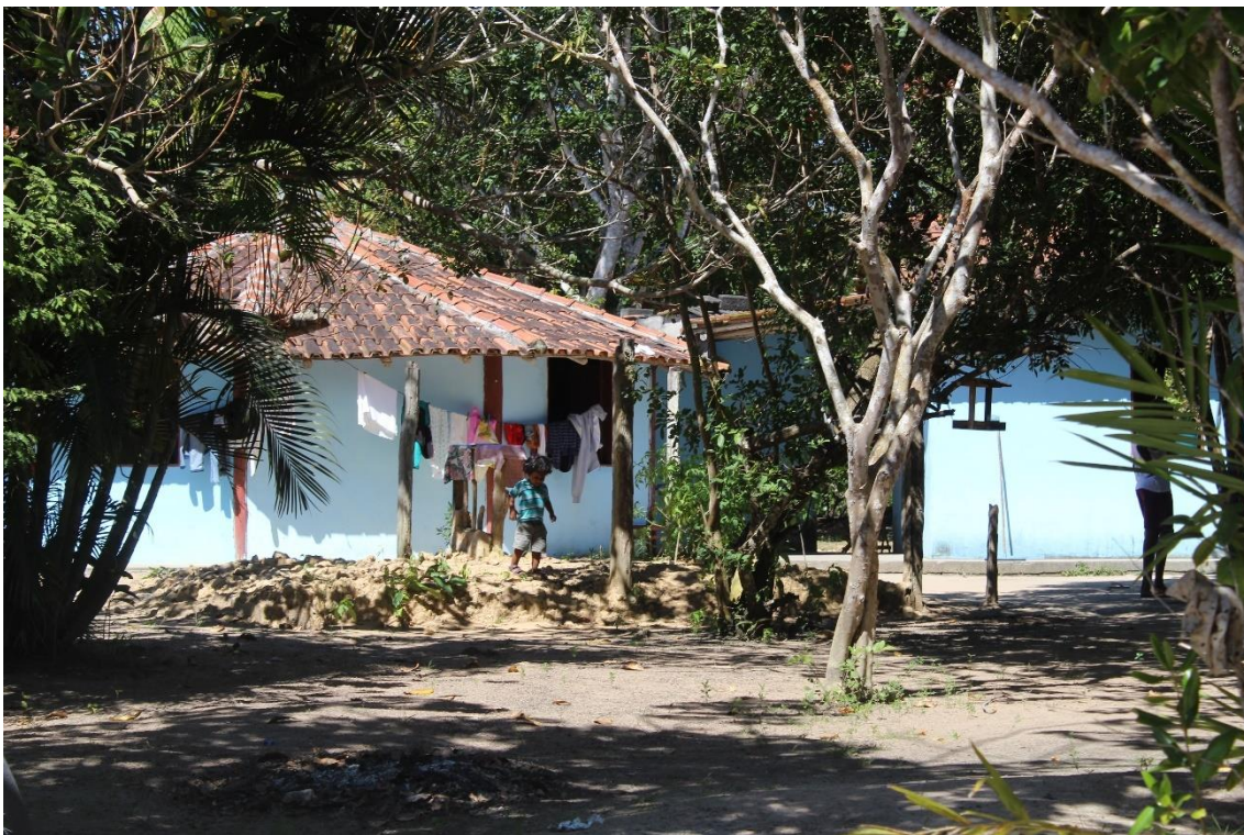
Figura 4: Oca de cultura da Zabelê.

Atualmente está Oca é utilizada como sala de aula para a creche do anexo Tibá e residem duas filhas de Zabelê que tomam conta da cabana.