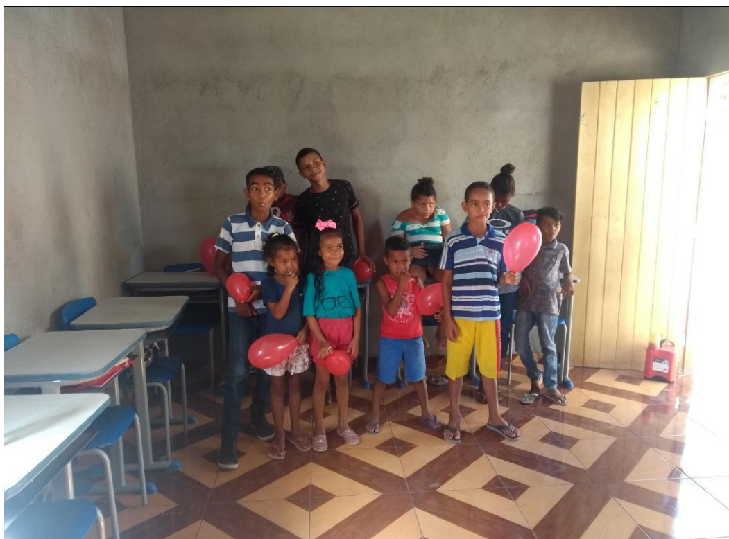
Figura 9: Alunos em nova sala construída.