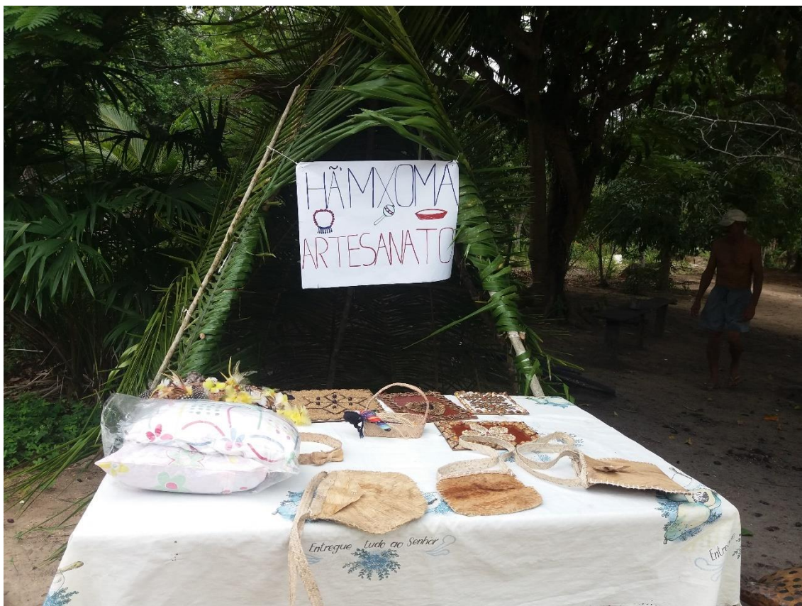
Figura 22: Mesa de artesanato feita por estudantes para o dia 19 de abril.