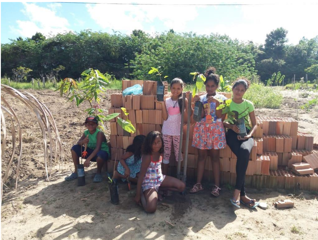
Figura 25: Estudantes em plantio no anexo Dois Irmãos.