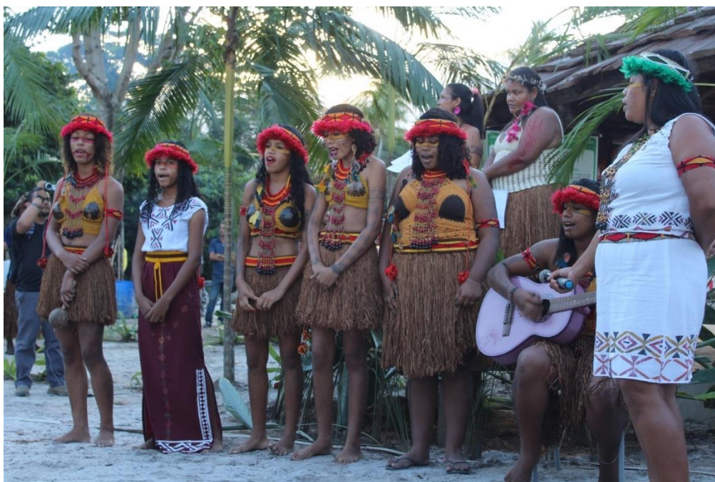
Figura 11: Grupo de cantoras jovens do ensino médio que compõe músicas em patxohã. (Arquivo autoral)