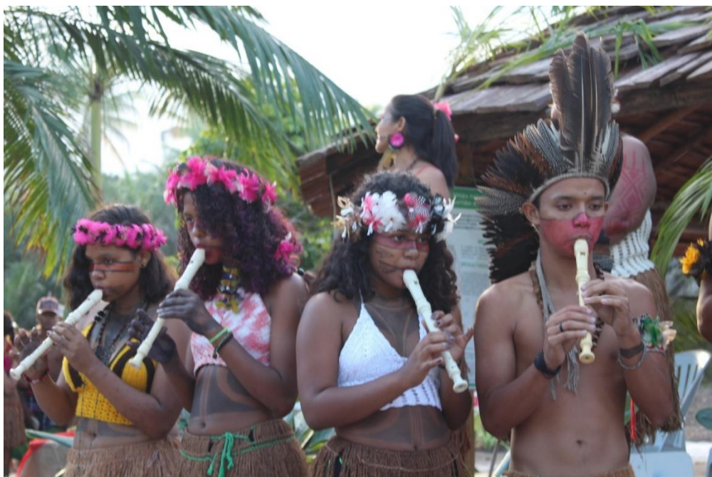
Figura 20: Estudantes em apresentação cultural no dia da celebração do termo de compromisso. (Arquivo autoral)