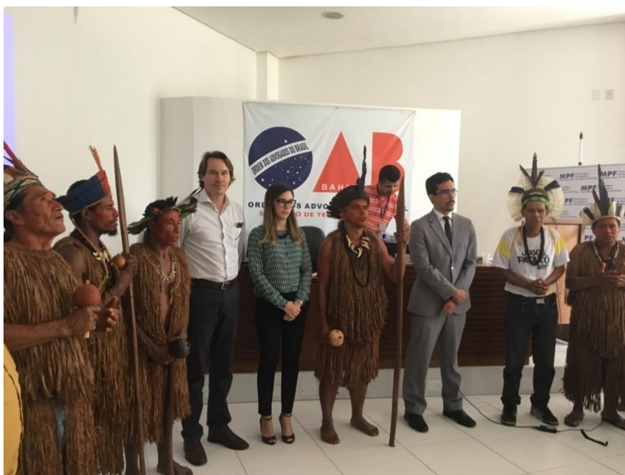
Figura 1: Foto: Presidente do ICMBio de camisa branca com indígenas e representantes da FUNAI e MPF na OAB de Teixeira de Freitas- BA.

Após quase três meses de ocupação, em 31 de maio de 2017, na sede do Ministério Público Federal em Teixeira de Freitas (BA), o presidente do ICMBio e lideranças Pataxó assinaram um acordo que previa a desocupação da base do PND e o estabelecimento de um Grupo de Trabalho Interinstitucional com o objetivo de elaborar um Termo de Compromisso (TC).