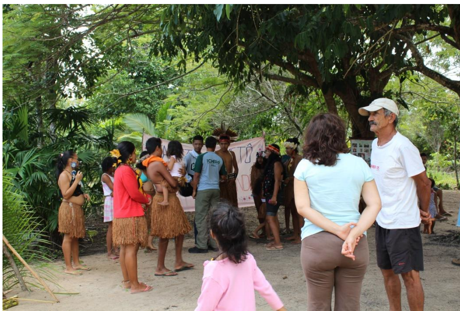
Figura 18: Membros institucionais em apresentação cultural na aldeia Tibá.

Nesse processo de luta tivemos muitos avanços, conquista, e também muitas dificuldades. Em 2017 graças a Niamisun (DEUS) iniciou um outro processo só que dessa vez foi para se construir um acordo entre as aldeias de dentro do parque e o Icmbio, esse acordo foi chamado como termo de compromisso, graças a DEUS hoje temos paz. (Welliton, jovem liderança. Fonte: entrevista realizada pela autora jun/2020).