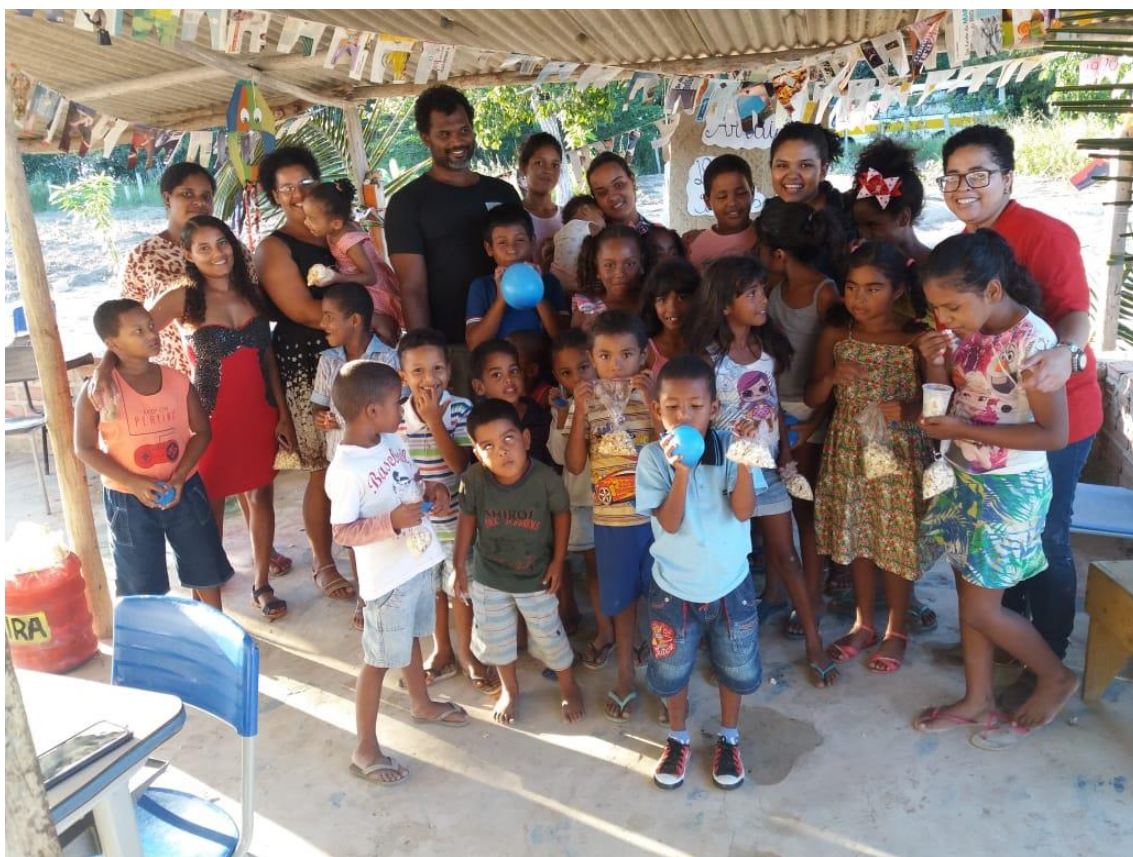
Figura 11: Estudantes e professores em confraternização no anexo Dois Irmãos.

Desde a retomada a educação se dava de forma voluntária, as crianças estudavam em Cumuruxatiba ou em aldeias vizinhas. Em 2015 essa aldeia passou a ser anexo da Kijetxawê Zabelê pela demanda da comunidade, nesta área foi construída pela própria comunidade a sala de aula que atende alunos da educação infantil, fundamental I e EJA, atingindo cerca de 40 alunos tendo também alunos especiais, que contam com 3 professores e 1 apoio. A aldeia não possui luz elétrica e nem água encanada, tudo que tem na aldeia foi a comunidade que construiu com muito esforço. Mais uma vez a escola como estratégia de luta ganha forças na TI Comexatibá.