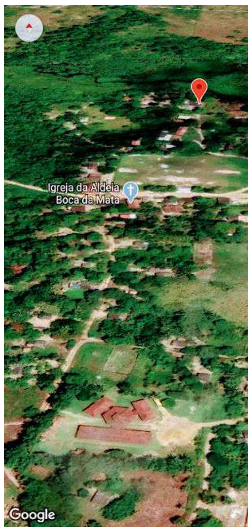
Imagem 5 - Mapa Google Earth via satélite Aldeia Indígena Pataxó Boca da Mata, Porto Seguro-BA 2020