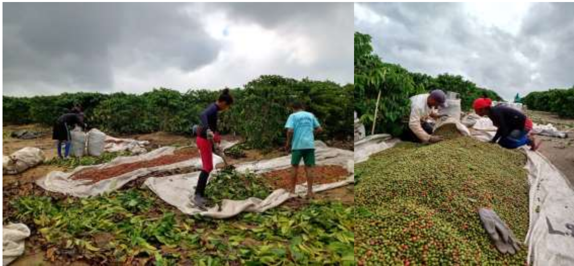
Imagens 16 e 17 - Colheita de café na fazenda Zé Roque. Fotografia de Edi Pataxo, 2020.

ficaram até com medo de falar que eram indígenas ou moravam na aldeia Boca da Mata; já não podíamos passar na estrada que dava acesso a cidade, ficamos vários dias sem comprar mantimentos ou fazer qualquer tipo de atividade na cidade; e com todo esse processo da retomada de algumas fazendas improdutivas onde os fazendeiros não pagam impostos, hoje os fazendeiros arrumaram uma forma para não perder as suas terras, começaram a plantar banana, pimenta do reino, café, maracujá, e mamão e começaram a contratar alguns indígenas pra trabalhar “olha que coisa boa”; por uma lado até pode ser, mas por outro acredito que fizeram assim como uma forma do governo não demarcar nossa terra, já que a nossa defesa eram as terras improdutivas, enquanto isso uma das lideranças está presa e outro com prisão domiciliar.