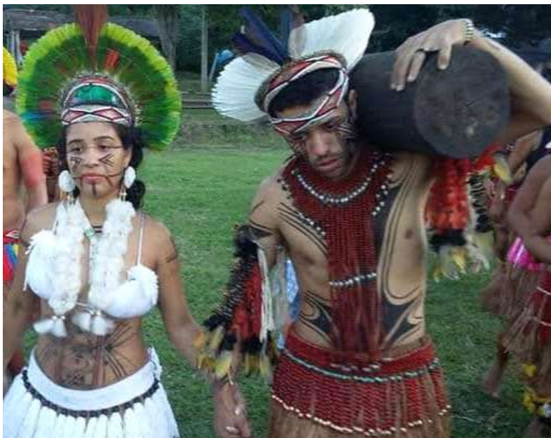
Imagem 1 - Carregamento da tora para garantir o casamento. Fotografia de Carleone Filho, 2015