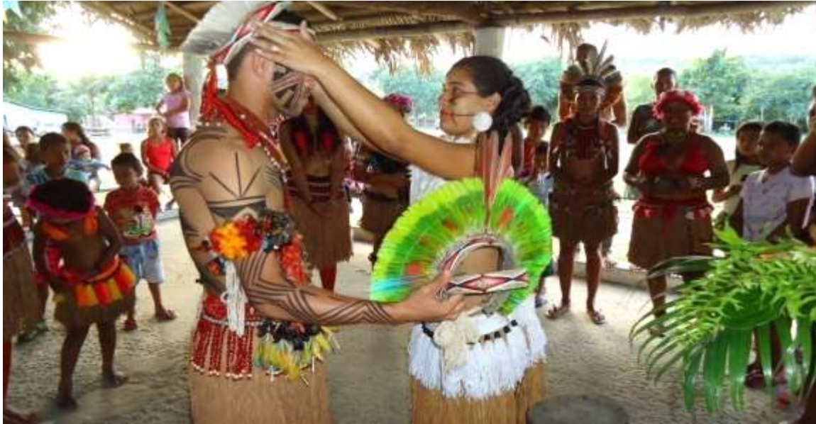
Imagem 3 - Meu casamento cultural na Aldeia Boca da Mata. Fotografia de Carleone Filho, 2015.

Após a minha pesquisa sobre o casamento tradicional Pataxó organizei a cerimônia com as lideranças, o cacique e o Pajé e me casei na cultura Pataxó. Convidei toda a comunidade, logo depois o próprio pajé me disse que foi o primeiro casamento tradicional realizado na Aldeia Boca da Mata.