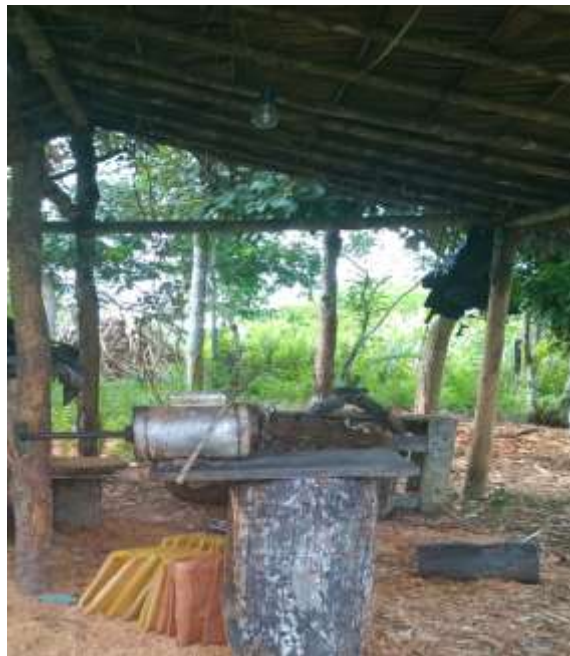
Imagem 10 - Motores elétricos instalados na Aldeia Boca da Mata.