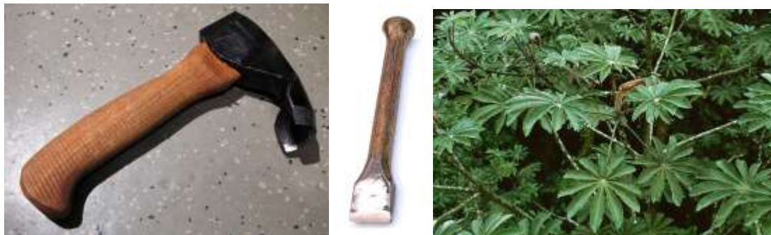
Imagens 7, 8 e 9 – Enxó, formão e folhas de Embaúba.