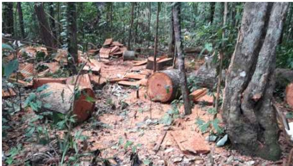
Imagem 13 - retirada de madeira no Parque Nacional.

Embora os indígenas sejam acusados de desmatar a floresta, esse tipo de desmatamento de árvore centenária que acaba não só com o ambiente, mas acaba também com a ancestralidade, dificilmente teria sido feita por um indígena que nem tem instrumento, um maquinário de última geração para cortar uma madeira desse tipo e nem condições para transportar essa madeira que seria por meio de trator ou caminhão. Até mesmo não temos caminhões que podem levar esse tamanho de madeira como podem ver nas imagens, os não indígenas que trabalham com o artesanato tem muito mais condições para levar uma quantidade maior de madeira do que nos indígenas, e com certeza esse impacto é diferente. Embora somos acusados de desmatar a floresta existe um tipo de desmatamento que não fazemos, nós usamos madeiras mortas, caixeta, eucalipto, bambu.