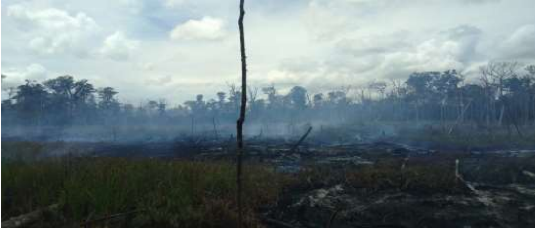
Imagem 33 - A mesma área queimada em minutos.