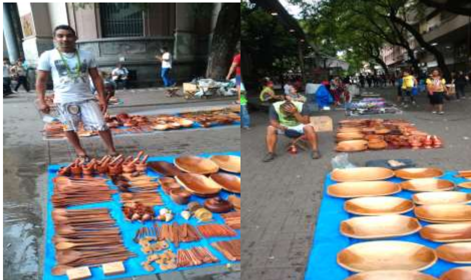
Imagens 21 e 22 - Comercialização do artesanato, na Praça 7, centro comercial de Belo Horizonte.

As pessoas que não vivem do artesanato, trabalham na educação são professores, mas a maioria trabalha por contrato temporário que duram 11 meses. A Escola Indígena Pataxó Boca da Mata contempla uma grande quantidade de funcionários e as turmas vão da Educação Infantil, até o Ensino Médio, assim tem merendeiras, vigias e pessoal que trabalham com serviços gerais, e isso contribui para as pessoas saírem da mata e pararem de fazer artesanatos. Tem também alguns aposentados, e muitas famílias são contempladas pelo Programa Bolsa Família com um pequeno valor que dá apenas para coisas mínimas e acabam completando sua renda fazendo o artesanato, e outras pessoas trabalham na saúde na Secretaria Especial de Saúde Indígena (SESAI), como técnico de enfermagem, auxiliar odontológico, e agentes de saúde básica.