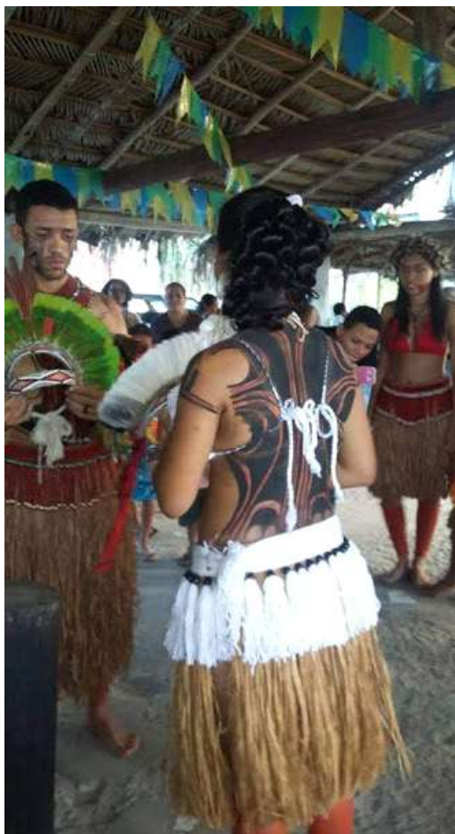
Imagem 2 - Troca dos cocares. Aldeia Boca da Mata. Fotografia de Carleone Filho, 2015.