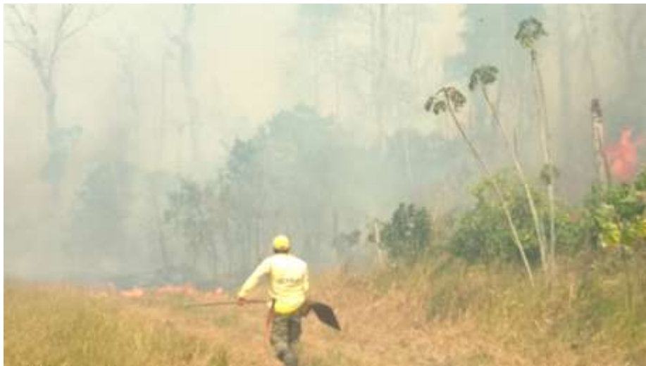
Imagem 32 - Começo da queimada do Parque Nacional. Fotografia: Arilton Pires Pereira, 2019.