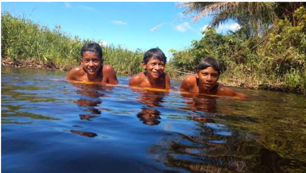
Imagem 34 - Aldeia Boca da Mata.

A floresta está descansando durante essa quarentena. Outro dia passei em uma das trilhas que os serralheiros de madeira passavam para trabalhar e até a estrada está se recompondo dos estragos causados pelo homem, muitas famílias já têm horta orgânica, no quintal de suas próprias casas; outros estão trabalhando em conjunto, aquele que não tem um pedaço de terra pra plantar está sobrevivendo do auxílio emergencial. Até mesmos montamos uma feira com hortaliças e vários tipos de artesanatos na nossa própria comunidade e essa ideia deu muito certo porque foi uma forma de ajudar um ao outro; é assim que a comunidade Indígena trabalha mas sabemos que esse auxílio não vai durar para sempre, a pandemia vai passar e logo em breve tudo voltará ao normal, o governo e a Fundação Nacional do Índio (FUNAI) deveriam investir mais nas comunidades que assim acabaríamos com o desmatamento do Parque Nacional, tenho certeza que outras oportunidades surgirão para assim avançarmos pra vencermos mais uma batalha.