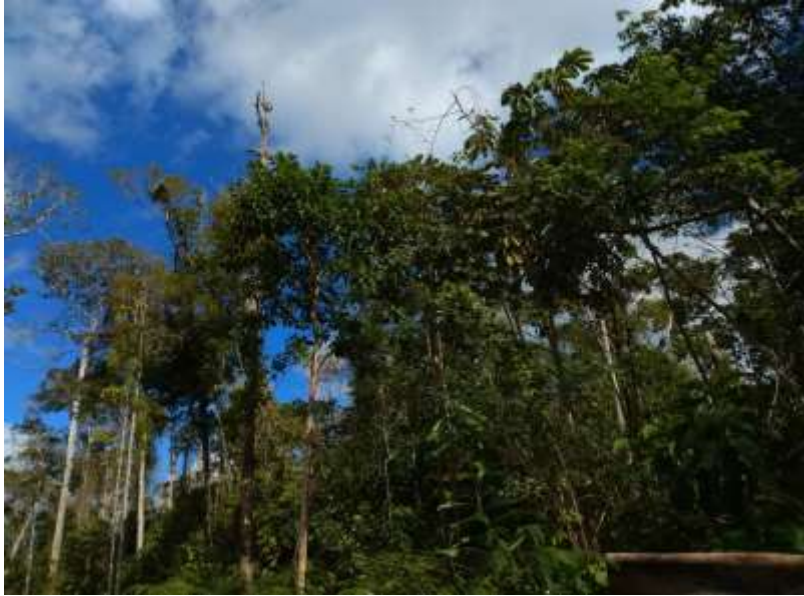
Imagem 31 - Uma das partes da floresta do Parque Nacional do Monte Pascoal horas antes de ser queimada. Fotografia: Arilton Pires Pereira, 2019.