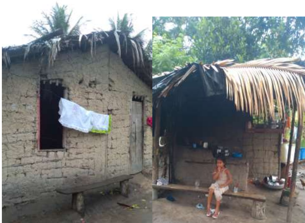
Imagens 29 e 30 - Modelo de casa tradicional.