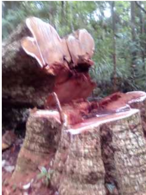
Imagem 12 - Derrubada de madeira no parque Nacional. Fotografia de Tohō Pataxó, 2020.

Já tivemos várias brigas com esse órgão, porque eles já prejudicaram muitas famílias com fiscalização e apreensão de cargas de madeiras, embargaram alguns parentes ao fazer roças nos lugares que já foi uma queimada e era área de preservação, eu sei que devemos proteger a nossa mãe Natureza, mas eles têm que mostrar projetos para comunidade que serve de sustento e benefício para famílias Pataxó, resolvendo assim o problema do desmatamento bem como prolongar esse contrato, fazer processos seletivos que na maioria das vezes contratam mais pessoas das cidades para trabalhar na aldeia; por que não contratar da própria aldeia?