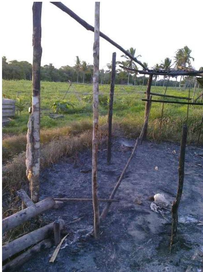
Imagem 15 - Área de retomada invadida pela força nacional. Fotografia de Juliana Pataxó, 2014.

Após tudo isso acontecer, recebemos uma liminar para desocupamos as terras. No momento não aceitamos, então veio a força tática da polícia nacional e exército; tentaram nos tirar a força, com balas de borracha e até armas com munições, todos saíram correndo pelas florestas mulheres com crianças, idosos eles não estavam nem somando quem era, atiraram bombas e bala de borracha e logo depois que saímos queimaram as casas e tudo que ficou no local inclusive os documentos de algumas pessoas.