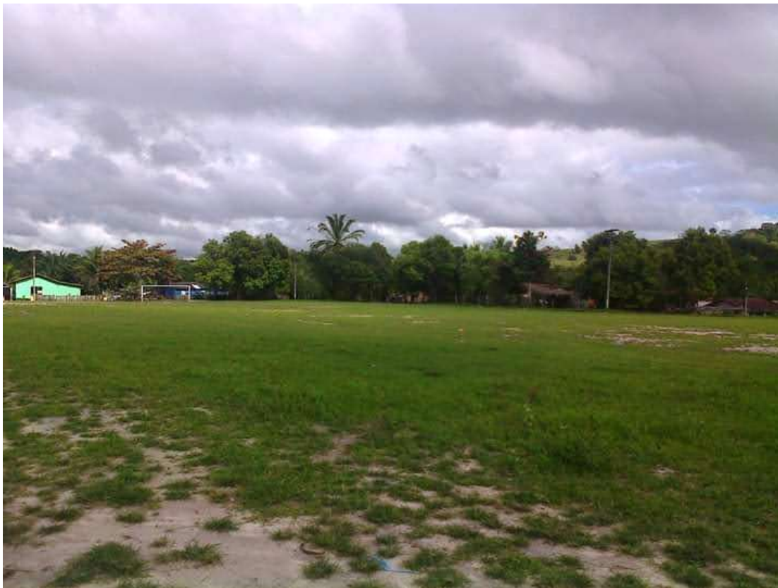
Imagem 6 - Centro da Aldeia Indígena Pataxó Boca da Mata. Fotografia de Edi Pataxó, 2019

Hoje o povo Pataxó vive no extremo Sul da Bahia nos municípios de Porto Seguro, Santa Cruz Cabrália, Itamaraju, Prado e também nos municípios mineiros de Carmésia, Araçuaí, Açucena e Itapeçerica; isso tudo aconteceu devido ao massacre de 1951 hoje conhecido por nós e pelos mais velhos como o fogo de 51; muitos dos nossos parentes se viram ameaçados em não poder se identificar como indígena, com medo de falar e voltarem a ser humilhados, até hoje muitos anciões que foram vítimas do massacre se sentem constrangidos em conceder uma entrevista ou falarem sobre o assunto e muitos vivem até nas cidades e ainda não revelam que são indígenas e nem querem voltar para aldeia com medo de viver tudo de novo.