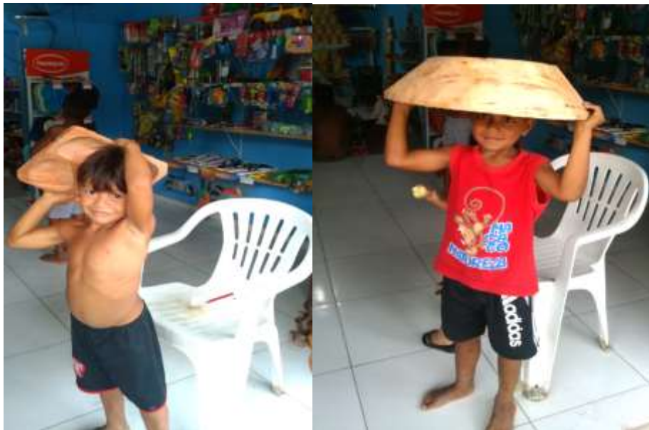
Imagens 19 e 20 - Comercialização do artesanato dentro da aldeia.

Montinho que fica no município de Itabela-BA. Os comerciantes não indígenas vão à aldeia comprar esses artesanatos, ou trocar por cestas básicas, a maioria desses comerciantes que antes não tinham nada, hoje já tem um mercado ou um comércio de alimentos, lojas de roupas, etc. na cidade. Eles pagam pouco pelos nossos produtos, mas cobram muito pelos produtos deles. Na aldeia Boca da Mata vivemos por base da troca, pois parentes que já tem um mercadinho na aldeia ajudam os próprios parentes através da troca. Neste caso o valor da troca é justo, e a dona do mercadinho fala que às vezes não tem tanto lucro que o objetivo dela é ajudar a comunidade, além disso, muitas vezes vende fiado, que é a prática de vender um produto ao cliente e não receber o pagamento à vista, essa prática é muito comum na nossa aldeia