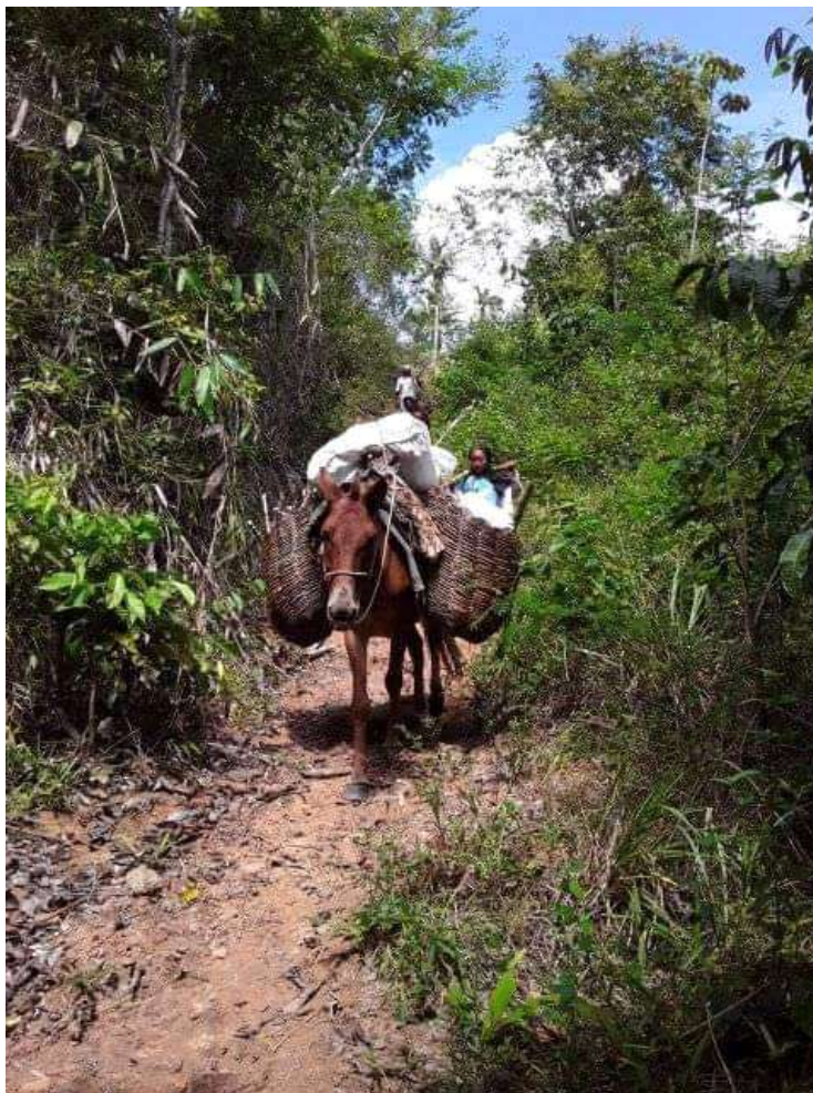
Imagem 14 - Meio de transporte usado para carregar madeira pelos indígenas.