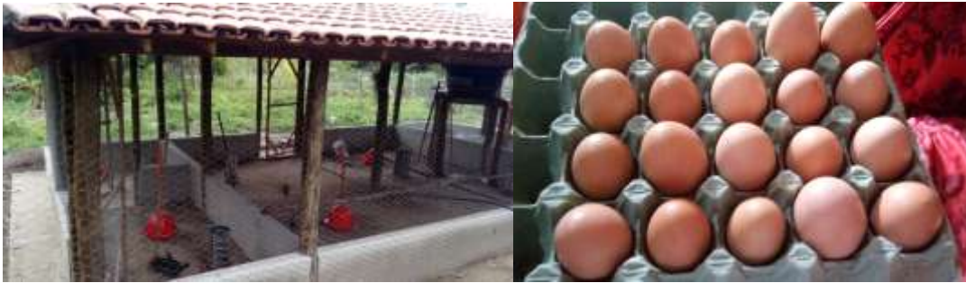
Imagens 23 e 24 - Galinheiro e ovos produzidos na Aldeia Boca da Mata através da Associação de Mulheres.

como horta comunitária, e recentemente vinte famílias foram contempladas com um projeto de criação de aves. O projeto ainda está pra terminar, já foram construídos quinze galinheiros e falta mais cinco para encerrarmos o projeto, mas mesmo assim ainda é pouco já que hoje a Aldeia Boca da Mata tem mais de 300 famílias.